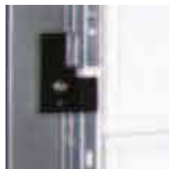
Couvre joint métallique.

L.2375 x H.2000 ; L.2375 x H. 2125 ; L.2500 x H. 2000 ; L.2500 x H. 2125.